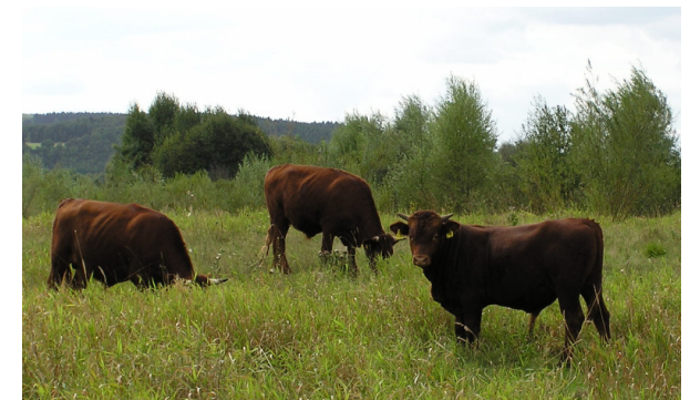
Rotes Höhenvieh in der Lahnaue;

Auf Flächen, auf denen bisher Weidenutzung vorherrschte ist das grundsätzlich auch weiterhin möglich. Sollten sich auf Weideflächen besonders zu schützende Tier- oder Pflanzenarten etabliert haben, kann eine vertragliche Regelung mit dem Nutzungsberechtigten die Sicherung dieser Qualität auf Dauer gewährleisten.