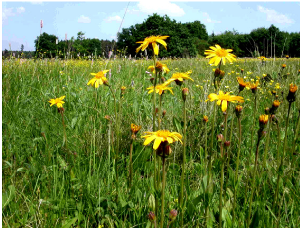
Borstgrasrasen (LRT 6230) mit Arnica montana

Die Einhaltung der GLP ist i.d.R. die Grundvoraussetzung für den Erhalt von Finanzhilfen für die Bewirtschaftung landwirtschaftlicher Flächen. Darüber hinausgehende Vereinbarungen in NATURA 2000-Gebieten oder nur in besonderen Teilbereichen von ihnen können über die Vorgaben dieser allgemeinen Regeln hinausgehen. Dies kann z.B. den Mahdzeitpunkt und den Einsatz von Pestiziden oder Dünger betreffen.